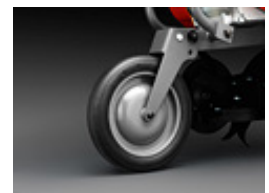
Rueda de apoyo