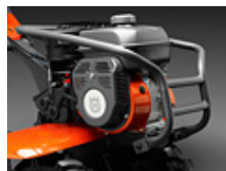
Motor a gasolina Husqvarna