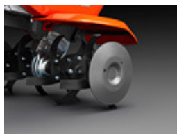
Proteja las plantas fuera del área de trabajo